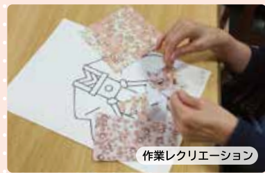
作業レクリエーション

毎日のレクリエーションは個別機能訓練から作業レクリエーション・脳力トレーニング・集団体操など、皆さんで楽しく時間を過ごしていただけるよう創意工夫をしております。季節の行事や外出プログラムも実施しております。