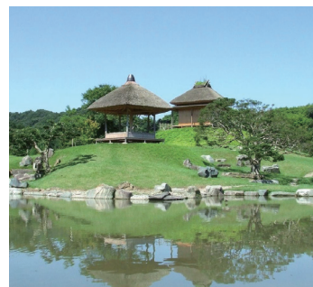
国指定名勝「楽山園」