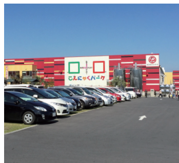
こんにやくパーク (株式会社ヨコオデイリース)