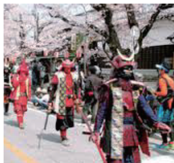
城下町小幡さくらまつり「武者行列」

「アットホーム尚久小幡」の周辺には、小幡城下町をはじめとする、数々の歴史的な観光スポットがあります。 古くは旧石器時代からの遺跡が確認されており、城下町の風情を今に伝える武家屋敷や、明治期の養蚕農家建造物群が残る小幡の町並みの中を流れ、住民の生活に溶け込んでいる雄川堰、その町並みを舞台として今なお受け継がれている伝統行事や民俗行事、さらに地理的条件を上手く活用して展開されている産業が一体となって甘楽町の歴史的風致を形成しております。